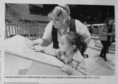
Una joven asistida a la teatralización observa la cartografía de Salamanca en el siglo XVI. | A.M. | 2017

Ver Salamanca 8 de julio de 2017 · Increíble éxito de público de "Salamanca, dulce nombre te dieron" esta tarde. Si aún no conocéis este recorrido teatralizado inspirado en La Celestina, podéis verlo los sábados y domingos, hasta el 27 de agosto, en dos pases, a las 12:00 y a las 20:00 horas. http://actividades.versalamanca.com/.../salamanca-dulce-.../