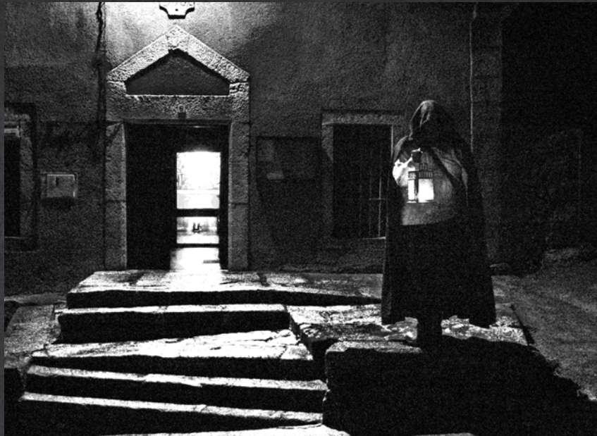
RUTA DE LA LEYENDA MONLERAS. EDICIÓN 2021. RUTA NOCTURNA QUE SE CELEBRA LA NOCHE DE TODOS LOS SANTOS.

PROPORCIONAMOS UN SERVICIO PERSONALIZADO QUE ABARCA NO SOLO LA PARTE INTERPRETATIVA, SINO TAMBIÉN LA CREACIÓN DEL GUIÓN, LA DOCUMENTACIÓN PREVIA, LA GESTIÓN DE LAS VISITAS... TRABAJAMOS A MEDIDA, CADA ESPACIO ES ESPECIAL Y DIFERENTE, Y LE DEDICAMOS TODO EL TIEMPO NECESARIO PARA QUE EL VISITANTE DISFRUTE DE UNA EXPERIENCIA ÚNICA.